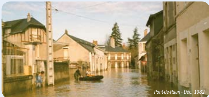
Pont-de-Ruan - Déc. 1982

Le Syndicat d'aménagement de la vallée de l'Indre a été sollicité à deux reprises ces dernières années par des compagnies d'assurance, qui souhaitaient mettre en cause le syndicat dans l'aggravation du risque d'inondation. Les affaires ont été classées sans suite.