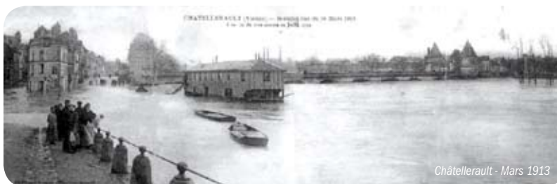
Châtellerault - Mars 1913

Contact : Fabien Blaize 05 55 06 39 42 - f.blaize@eptb-vienne.fr