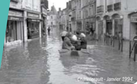
Châtellerault - Janvier 1994

La gestion du risque d'inondation en France s'articule autour de la mise en œuvre de la Directive inondation de 2007. À la suite d'un état des lieux réalisé à l'échelle nationale en 2011, 122 Territoires à Risque Important (TRI) ont été identifiés. Un TRI est un secteur où se concentrent fortement des enjeux humains et économiques exposés aux inondations.